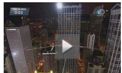
EN LA CUERDA FLOJA ENTRE DOS RASCACIELOS DE CHICAGO