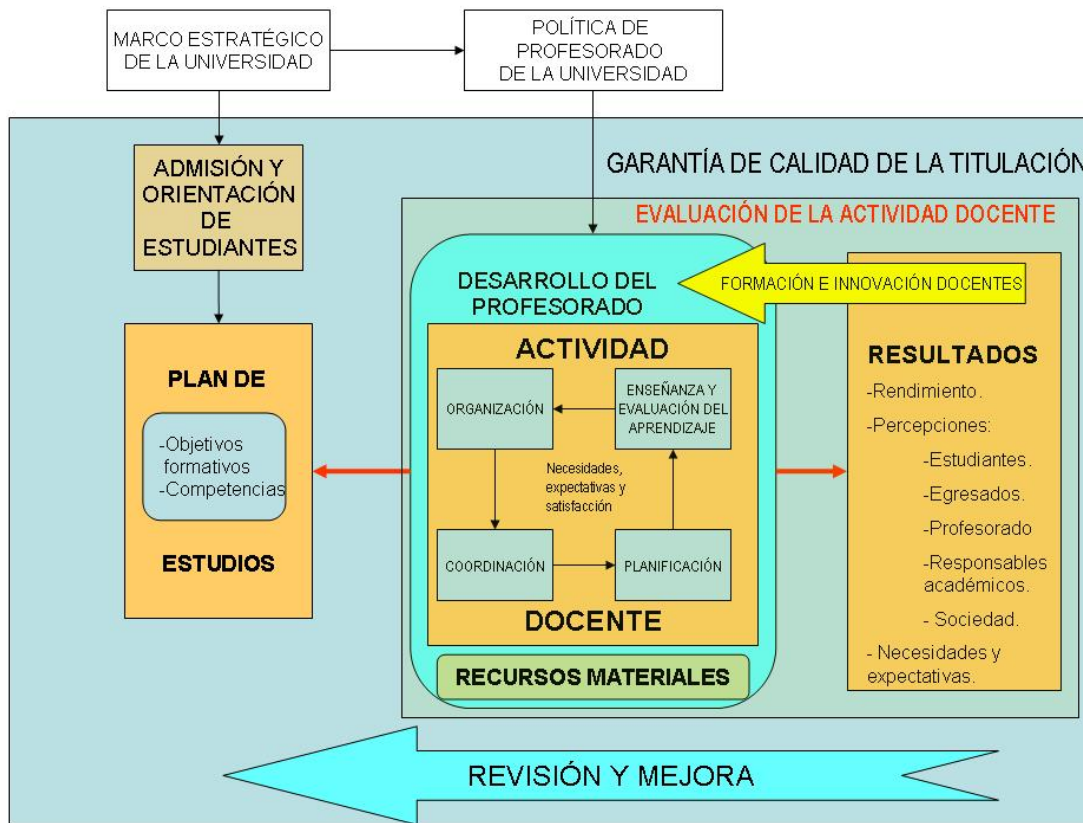
Figura 2. Plan de estudios y actividad docente

Los resultados de la actividad docente 5 se traducen en términos de los avances logrados en el aprendizaje de los estudiantes y en la valoración expresada en forma de percepciones u opiniones de estudiantes, egresados, responsables académicos y del propio profesorado.