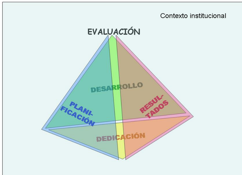
Figura 3. Dimensiones de evaluación de la actividad docente.

Las dimensiones consideradas se desagregan en los siguientes elementos: