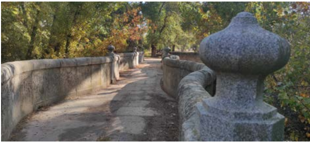
Puente de la Culebra