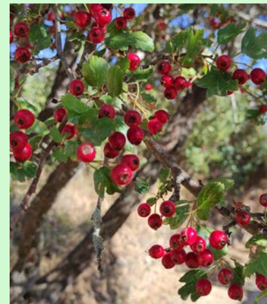
Majuelo ( Crataegus monogyna )

... por que aviendo comprado el señor Rey Felipe II la Casa del Campo, y tierras de su heredamiento, las incorporó, y agrego al Bosque del Pardo, por la Cédula 54 de doce de Mayo de 1567, sugetándolas al Alcalde Juez de Bosques, para que juzgase sus causas, por las leyes y Ordenanzas hechas para el Pardo.