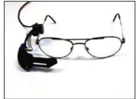
Prototipo de gafas para sordos