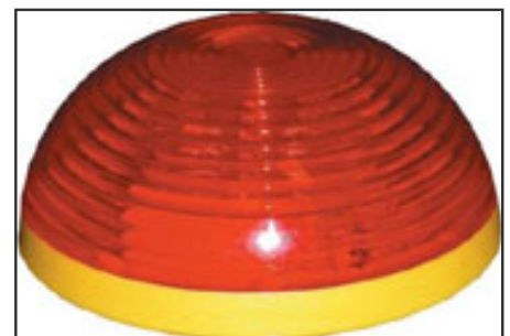
LEDs de alta luminosidad

Asimismo, sus actividades están centradas en la caracterización y modelado de láseres de pozo cuántico para aplicaciones de alta velocidad y potencia. En cuanto a la última línea de investigación, el profesor Otón admitió que su equipo se ha sumado a la tendencia de Europa y EE.UU. de renunciar al mercado de las pantallas planas de ordenador o TV doméstica ante el éxito asiático. Hoy trabajan en un terreno aún en desarrollo, el de las micropantallas, dispositivos de una pulgada con la misma resolución que una pantalla de ordenador normal y que se utilizan tanto para visión directa como para proyección.