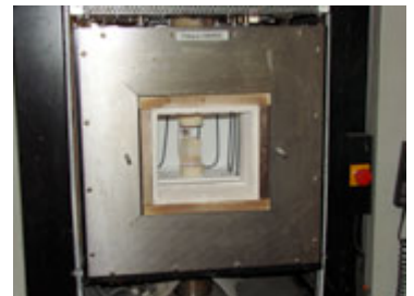
Horno de 1800 °C