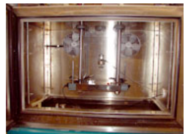
Dispositivo experimental para ensayos de hilo de araña