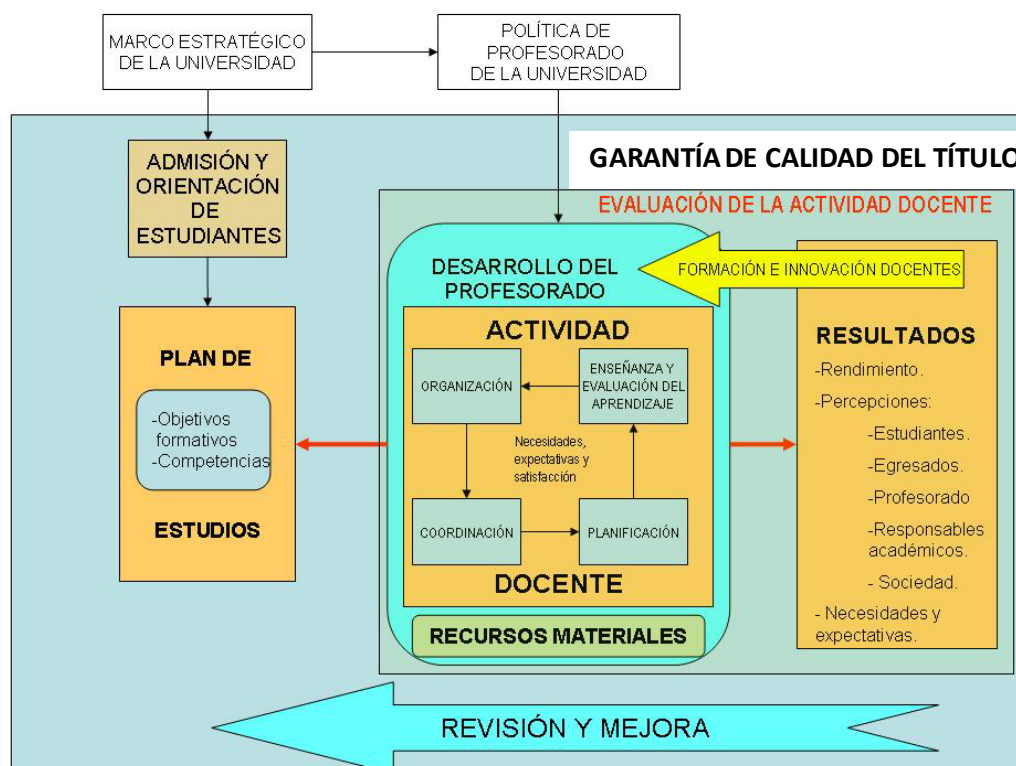
Figura 2. Plan de estudios y actividad docente

Los resultados de la actividad docente 7 , como factor esencial, se traducen en términos de los avances logrados en el aprendizaje de los estudiantes y en la valoración expresada en forma de percepciones u opiniones de estudiantes, egresados, responsables académicos y del propio profesorado. Los resultados de la actividad docente son también el fundamento de la revisión y mejora de los planes de estudios. De modo que, desde dichos resultados, se inicie un nuevo ciclo de formación.