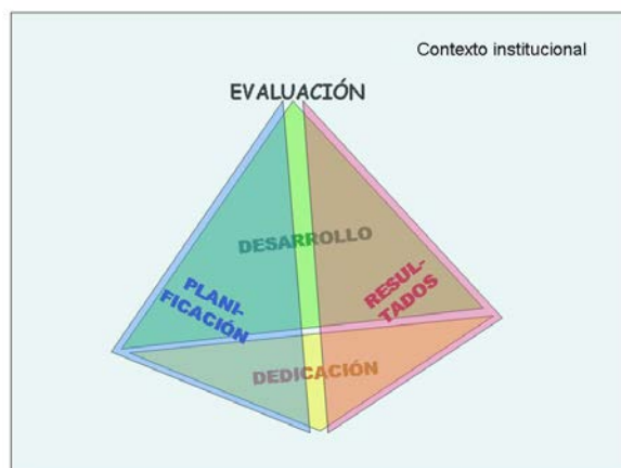
Figura 3. Dimensiones de evaluación de la actividad docente.