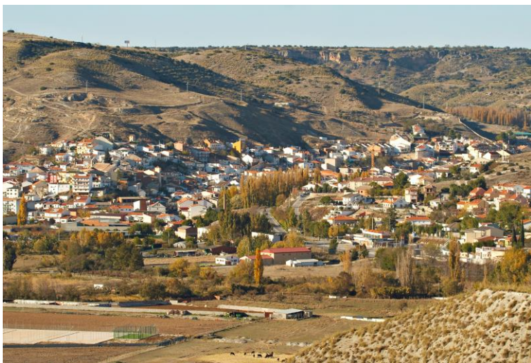
Vista de Perales de Tajuña desde el Cerro de Cabeza de los Bueyes

Finalmente, es importante saber valorar el rico legado cultural que suponen los yacimientos arqueológicos de Perales de Tajuña, no siempre vistosos ni bien conservados, pues constituyen un elemento de interés cultural inigualable. La creciente sensibilización de autoridades responsables, estudiosos especialistas y de la sociedad actual, debe conducir a lograr los medios necesarios para poder valorar y conservar para el futuro este rico legado.