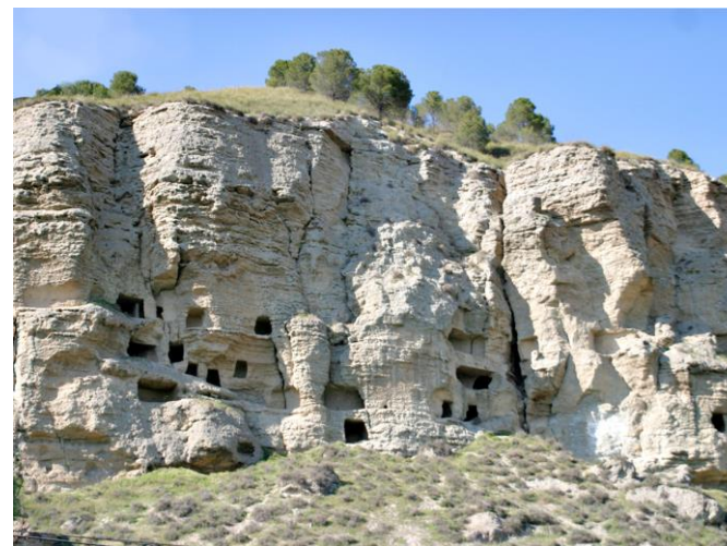
Risco de las Cuevas (monumento Histórico-Artístico en 1931)